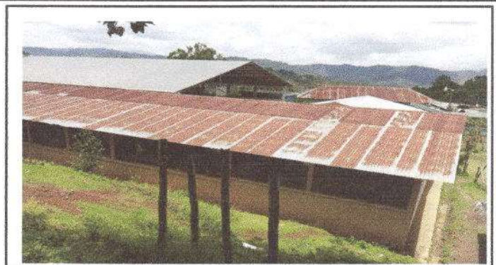
Foto 2: Sustitución de lámina, por lámina troquelada aluzinc calibre 26