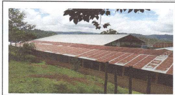
Foto 1: Sustitución de lámina, por lámina troquelada aluzinc calibre 26